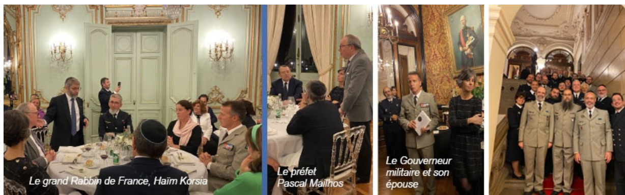
Le grand Rabbin de France, Haïm Korsia